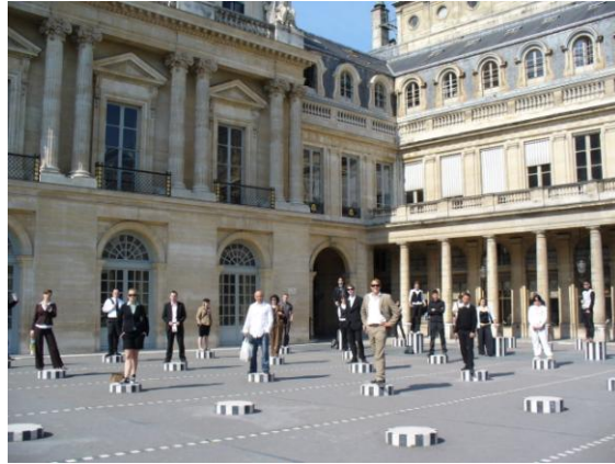
Danke allen Beteiligten!