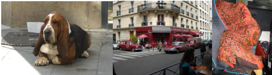
Was gibt es da noch zu sagen? Außer: .....stilvoll ..... und .....stil???