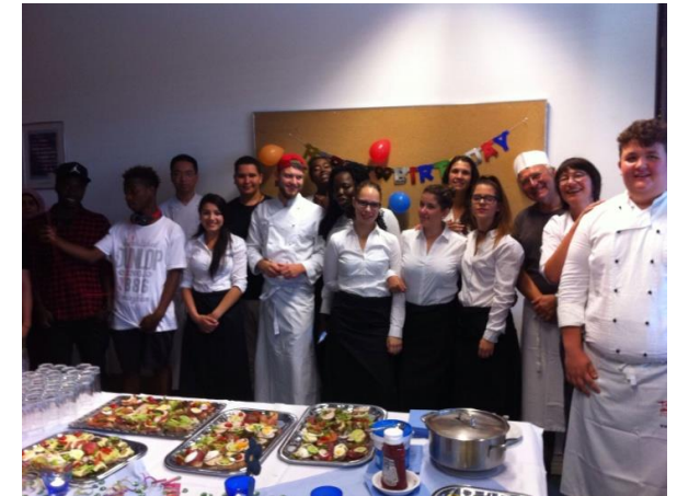
Foto: Berufsfachschulklasse BF52 und Willkommensklasse WK 5 bei einem Cateringauftrag unserer Schülerfirma